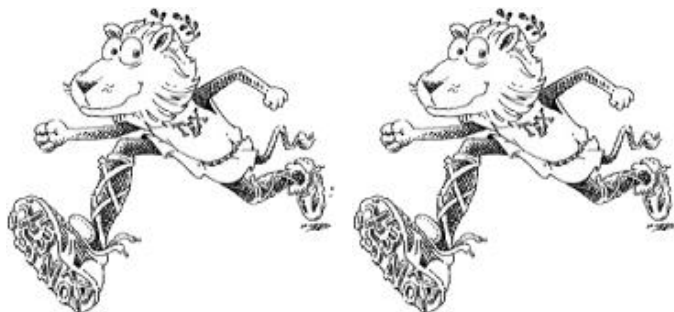
(ب) شیر ۲